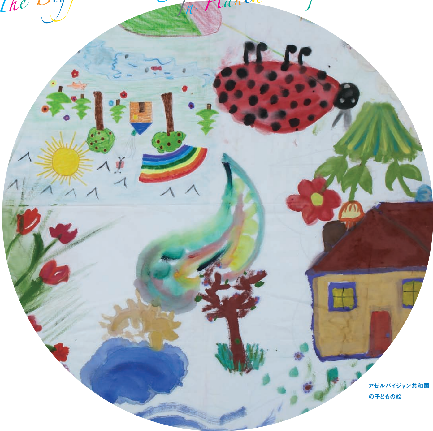
アゼルバイジャン共和国 の子どもの絵